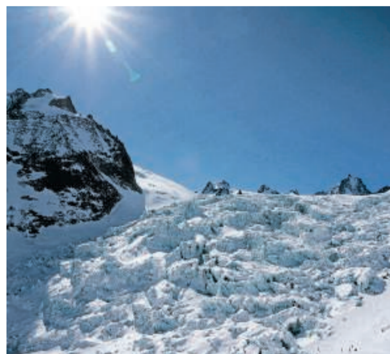
Das mächtige Vallée Blanche, durch das die Skitour nach Chamonix führte. Sicherheitsausrüstung und ein Bergführer, der die Route kennt, sind lebenswichtig. Sonst droht der Sturz in die Gletscherspalte.

F reitag, 6. März 2015, Zermatt, Schweiz. Ein traumhafter Wintermorgen. Die Sonne strahlt über der markanten Silhouette des wohl berühmtesten Berges der Welt – Wetter und Matterhorn zeigen sich von ihrer besten Seite. Auf der Helikopter-Basis vor den Toren des Fünfeinhalbtausend-Seelen-Ortes Zermatt geht es zu wie im Taubenschlag. Skifahrer lassen sich hinauffliegen in die verschneiten Hänge, um von dort großartige Abfahrten zu genießen. Diese Touristenflüge sind ein gutes Einkommen für die Helikopter-Basis