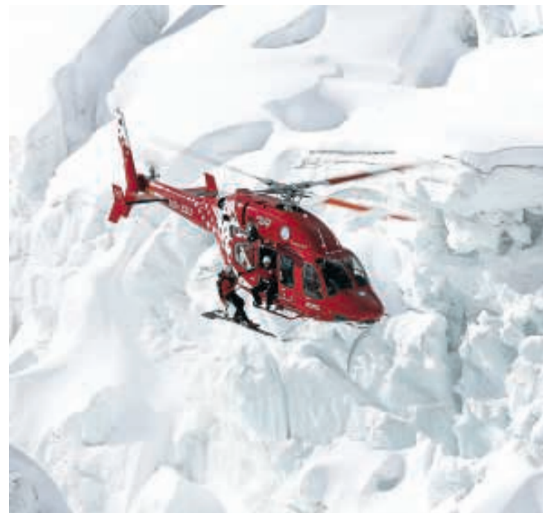
Der Rettungshubschrauber vor der Kulisse des gewaltigen Gletschers. Die Helfer dürfen keine Angst haben vor heiklen Einsätzen und dem Blick in die Tiefe.