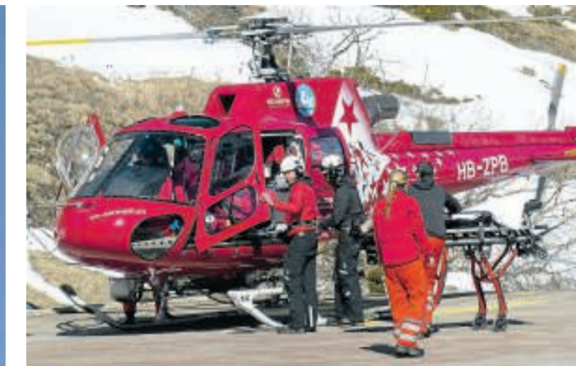
Die Crew ist mit einem Verletzten gelandet. Schnell wird die Trage in Position gebracht, um den Patienten möglichst bequem aus dem Heli zu bekommen.