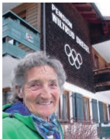
Ski-Ikone Wiltrud Drexel holte 1972 in Sapporo Bronze im Riesenslalom.