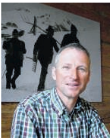
Olympiasieger Hubert Strolz will Traditionen erhalten.

Irgendwann liegt dann doch unser 164-Seelen-Dorf wieder zu unseren Füßen. Auf der Piste geht es hinab zum Einstieg der Tour. Welche Widmung an einen kühnen Skipionier.