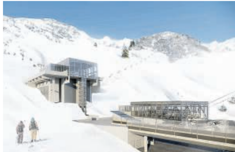
Schöne neue Skiwelt: Das Projekt „Flexenbahn“ will am Arlberg 2016/17 an den Start gehen. Damit wird das Skigebiet zum größten Österreichs.